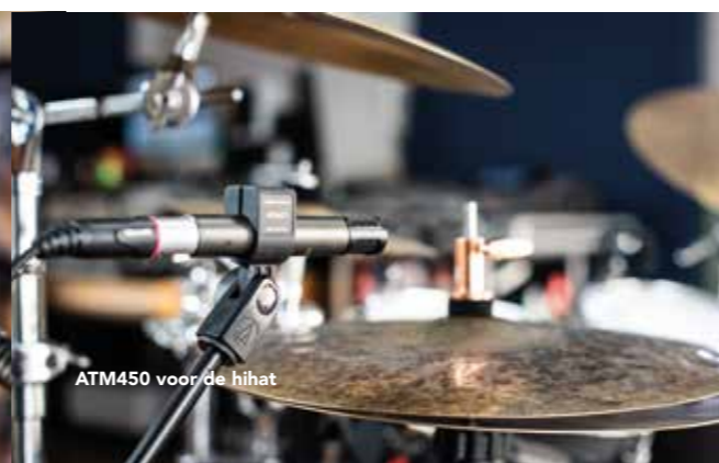
ATM450 voor de hihat