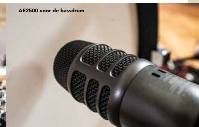
AE2500 voor de bassdrum