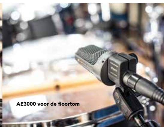
AE3000 voor de floortom