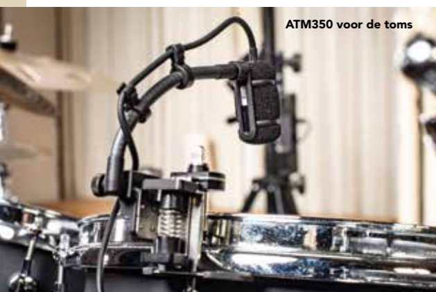
ATM350 voor de toms

'Voor de bassdrum heb ik de AE2500; nogal een slagschip. Hij heeft twee kapsels, dynamisch en condensator, maar in dit specifieke geval gebruik ik alleen de condensatorkant; er ligt een andere dynamische >>