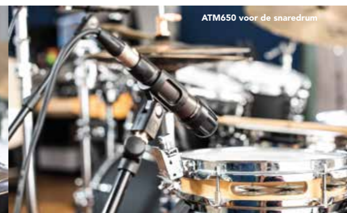
ATM650 voor de snaredrum